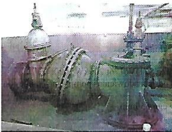
zdj. 3 -strop dolny POZIOM 0