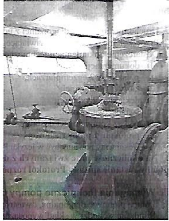
zdj. 2 -strop dolny POZIOM 0