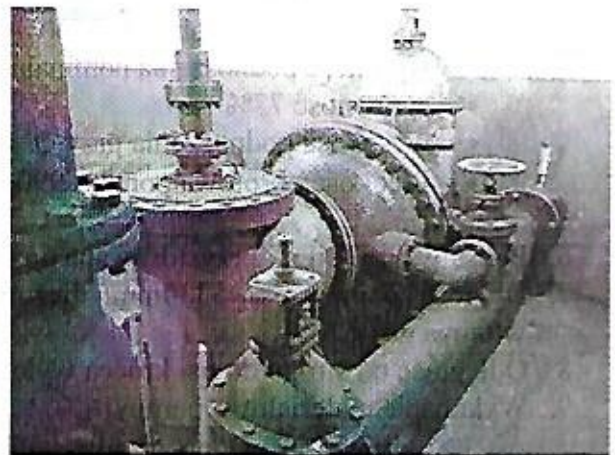
zdj. 4 -strop dolny POZIOM 0